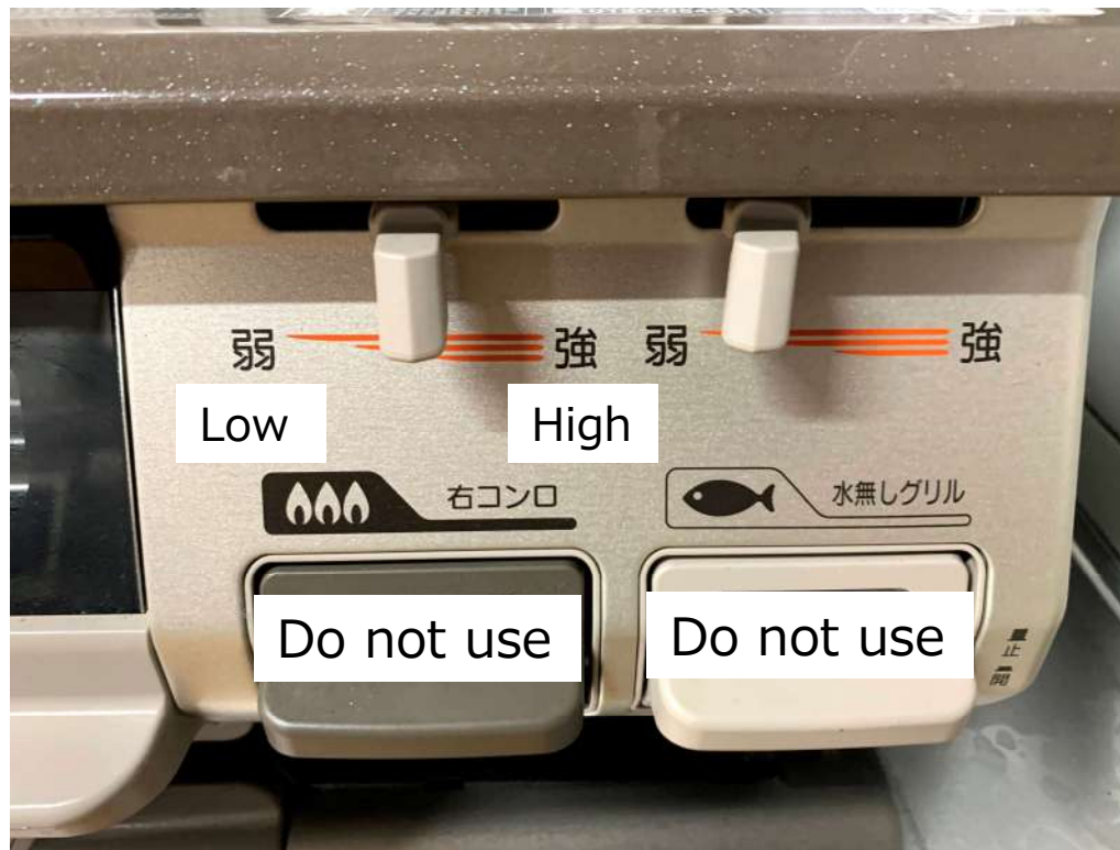
ガスコンロ Gas stove